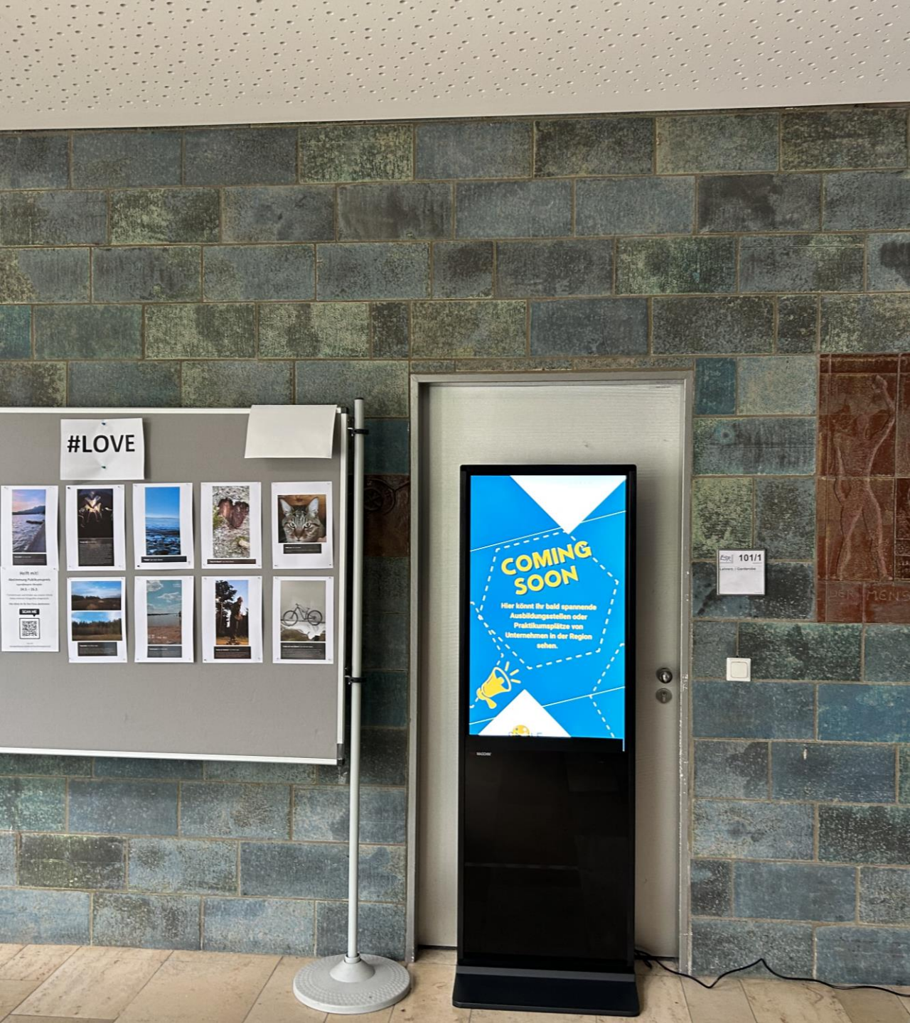
Die Azubisäule an einer bayerischen Realschule