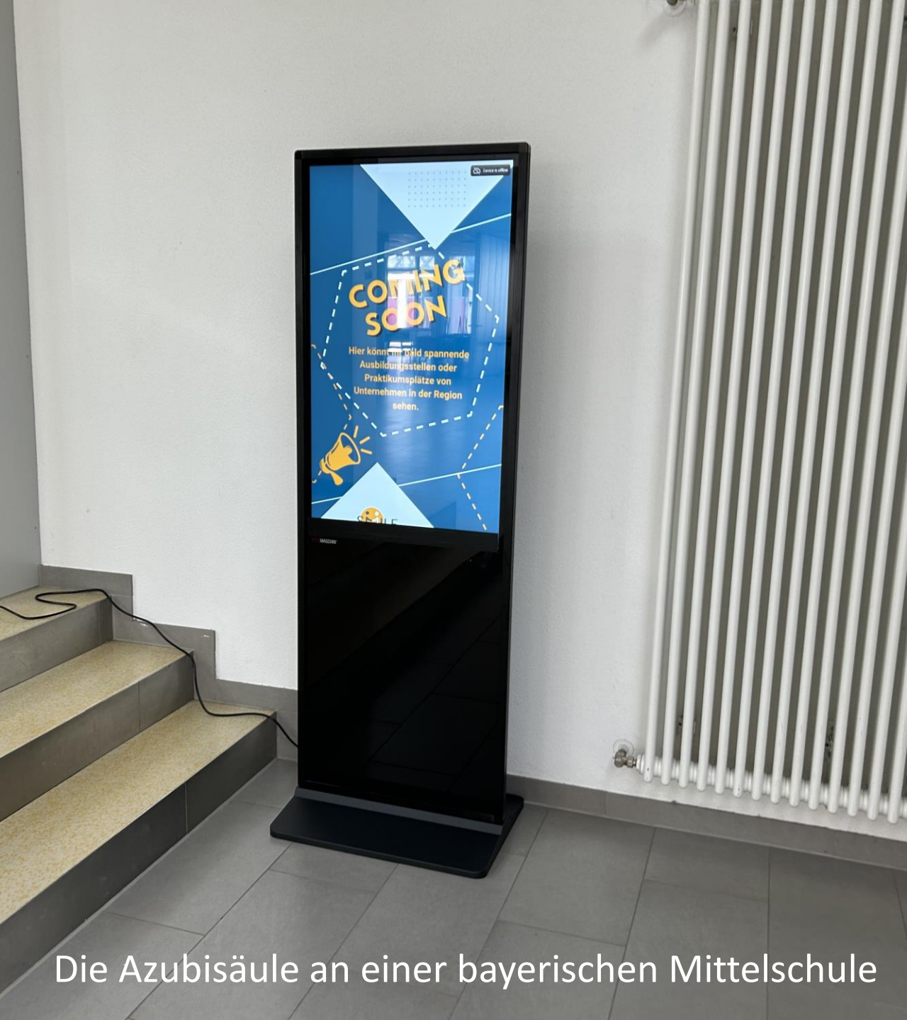
Die Azubisäule an einer bayerischen Mittelschule